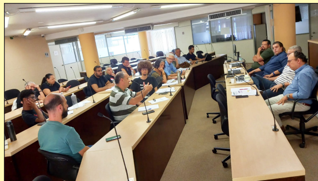
A reunião técnica, na reitoria da Unesp

O Fórum também solicitou a reativação do Grupo de Trabalho (GT) Previdência, com o objetivo de levantar informa-