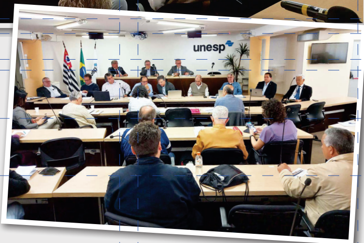
A negociação entre Fórum e Cruesp, na tarde de 18/5, na reitoria da Unesp

res que permitem prever uma arrecadação superior aos R$ 144,1 bi, possivelmente dentro da previsão inicial. Neste ponto, criticaram a postura do Cruesp, que não cobrou o repasse dos 9,57% às universidades da compensação paga pela União ao estado de São Paulo, por conta da queda do ICMS oriundo dos combustíveis, energia elétrica e comunicações. A estimativa do Fórum, que já questionou formalmente o governador Tarcísio de Freitas sobre isso, é que as universidades deixaram de receber cerca de R$ 644 milhões entre agosto/2022 e janeiro/2023. Registre-se que os municípios estão recebendo a sua parte (25% do total do ICMS) com estas compensações, diferente das universidades.