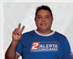
Reliton Silva Cirúrgica 2 HC