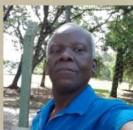
Orlando - Aposentado CPQBA