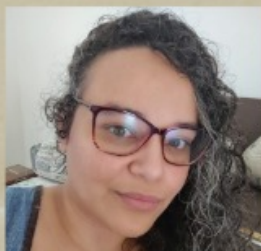
Marina - IFCH