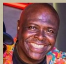
Eson Kung Fu - IA