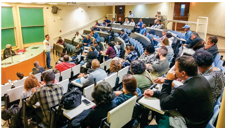
Trabalhadores em assembleia decidem pela continuidade da greve e apresentação de contraproposta

Hoje tem vigília em frente à reitoria, às 9h, para cobrar o reitor Knobel