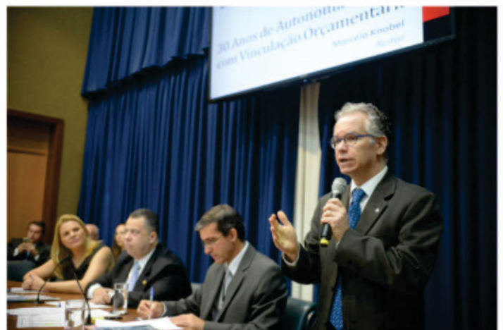
O reitor da Unicamp em sua exposição inicial na CPI das Universidades, na Alesp.

(PRB) voltou a dar mostras de arrogância. Após cobrar do reitor da Unicamp o envio de contratos e outros dados dos últimos oito anos e ouvir que a informação havia sido dada eletronicamente, Moura disparou: “Nós queremos tudo em papel. Se não for possível, podemos providenciar um mandado de busca e apreensão.”