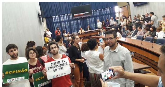
A primeira sessão da CPI, em 24/4

As Universidades também veem seus orçamentos serem cada vez mais comprometidos com aposentadorias e pensões, sem