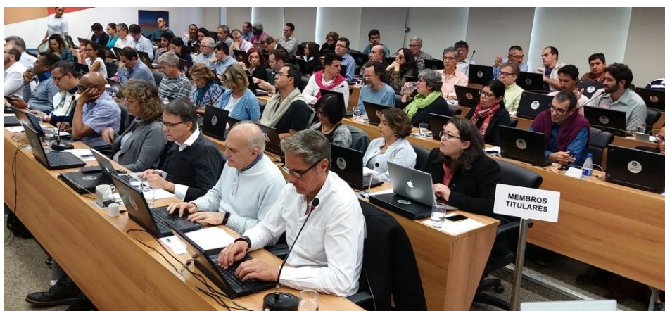
Reunião do Conselho Universitário da Unicamp homologa reajuste de 1,5%

Após suspender unilateralmente a negociação prevista para 30/5, o Cruesp agendou nova reunião com o Fórum das Seis para amanhã (7), às 15h30, em São Paulo.