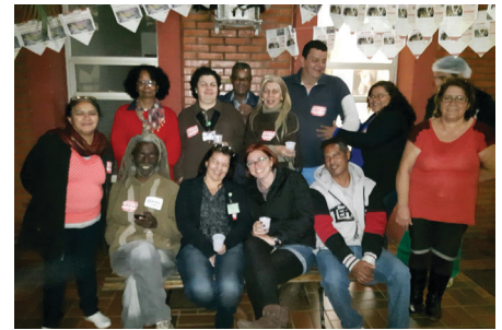
Atividade cultural no Caism marcou a construção da greve no noturno