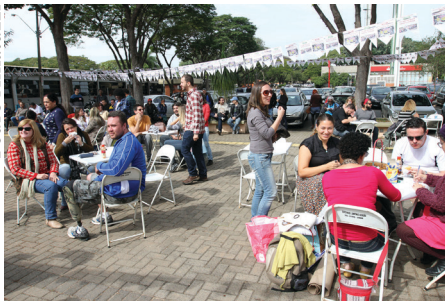
Festa junina da greve do milhão foi um sucesso e reuniu grevistas em atividade cultural