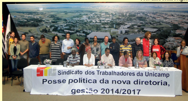
Cerimônia de posse da nova gestão do STU