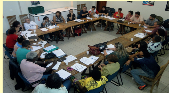
Primeira reunião da nova diretoria do STU ocorreu na segunda (5)

BOLETIM DO STU é uma publicação do Sindicato dos Trabalhadores da Unicamp - gestão "2014 - 2017" Textos: Fernanda de Freitas e Luiza Giovancarli Edição: Luciana Araújo Editoração Eletrônica: Pedro Lucas - Tiragem: 5 mil exemplares - Impressão: Artes Gráficas Oliveira Contatos: 3521-7412 / 3521-7147 / 3289-4242 / 3289-3502 INTERNET: www.stu.org.br EMAIL: imprensa@stu.org.br FACEBOOK: stu.unicamp